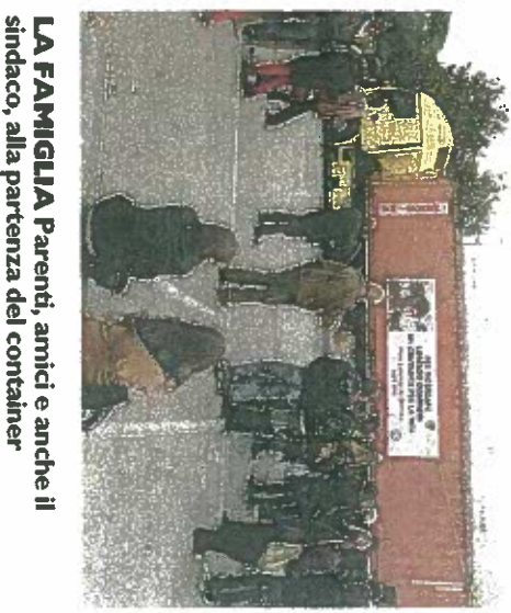
LA FAMIGLIA Parenti, amici e anche il sindaco, alla partenza del container